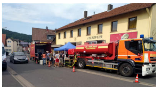
Tanklöschfahrzeug mit Brauchwasser